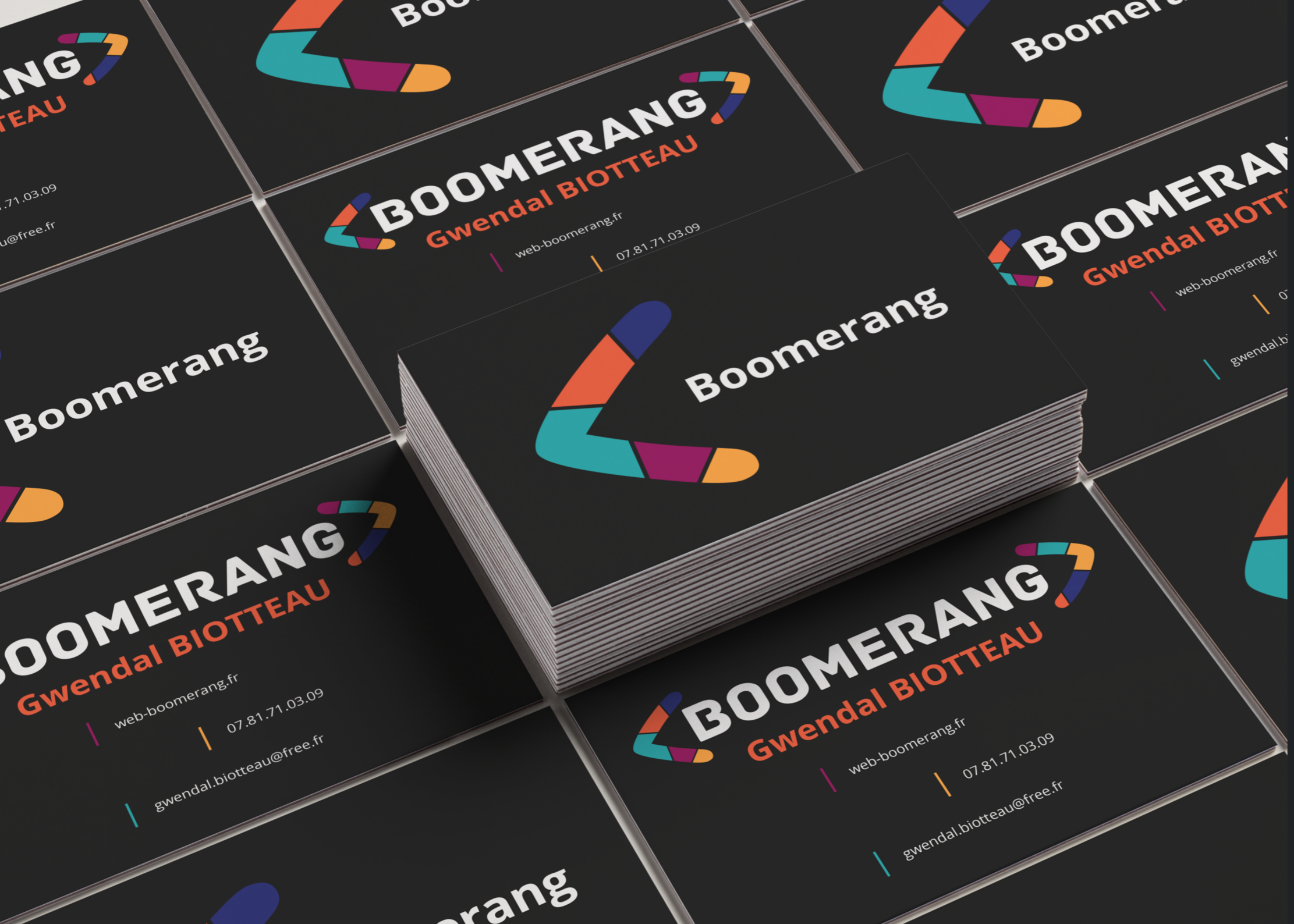
Carte de visite